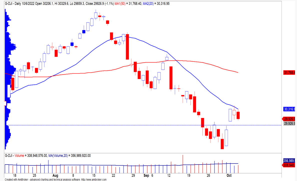
Diễn biến chỉ số Dow Jones.