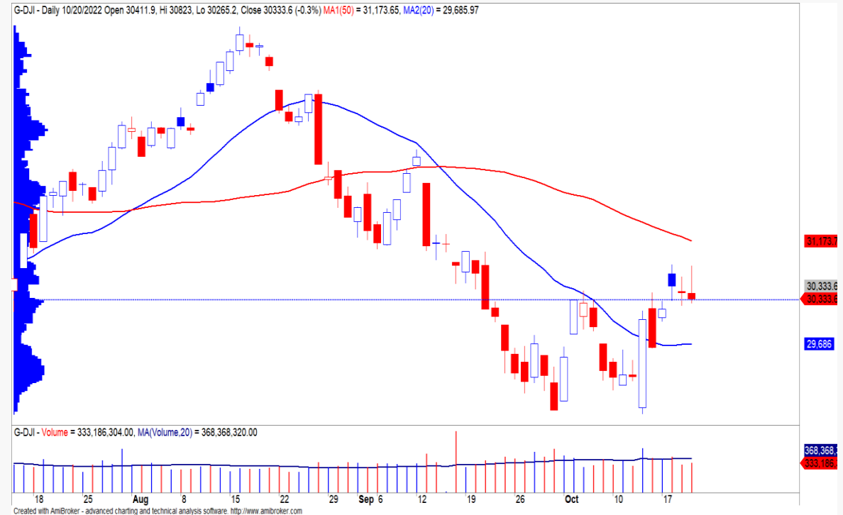
Diễn biến chỉ số Dow Jones.