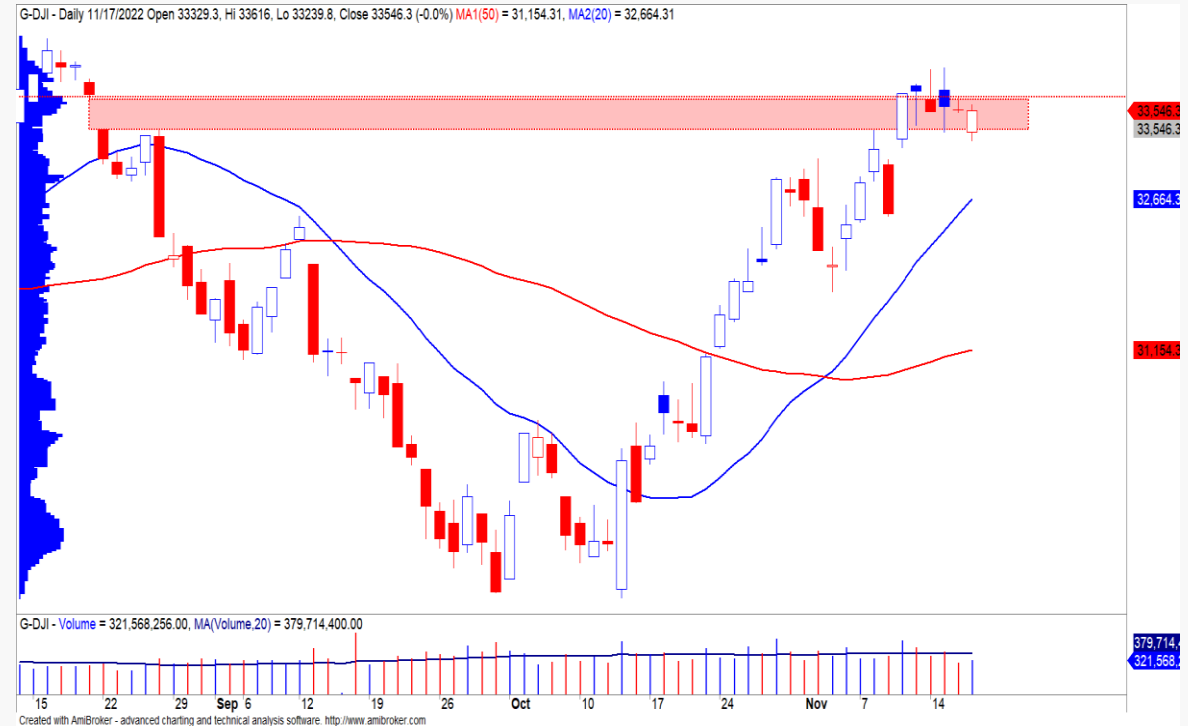
Diễn biến chỉ số Dow Jones.