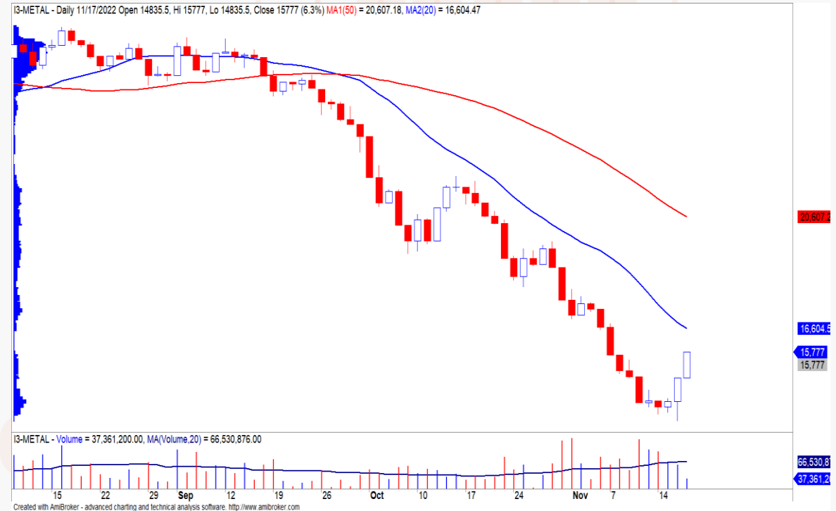
Diễn biến nhóm cổ phiếu Kim loại.