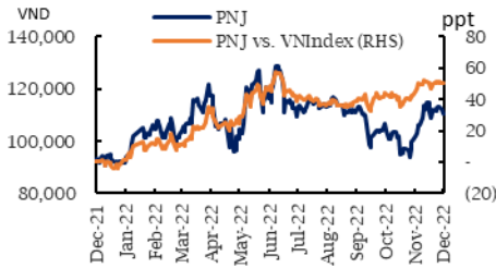
Tương quan giá CP với VN-Index

Mức tăng (giảm) giá mục tiêu +23,6% Đóng cửa 21/12/2022 Giá 109.600 đồng Giá mục tiêu 12T 135.453 đồng