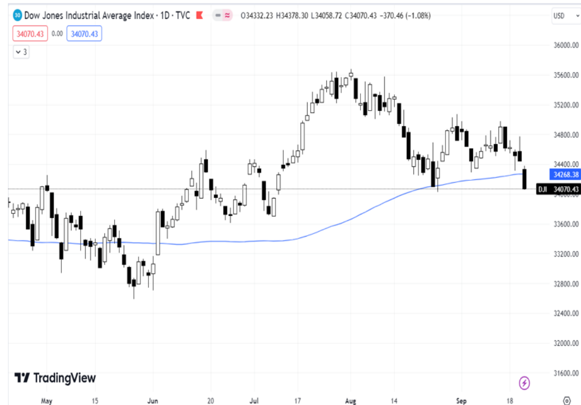
Diễn biến chỉ số Dow Jones.