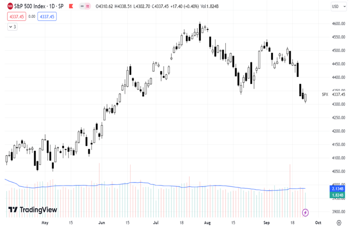
Diễn biến chỉ số S&P 500.