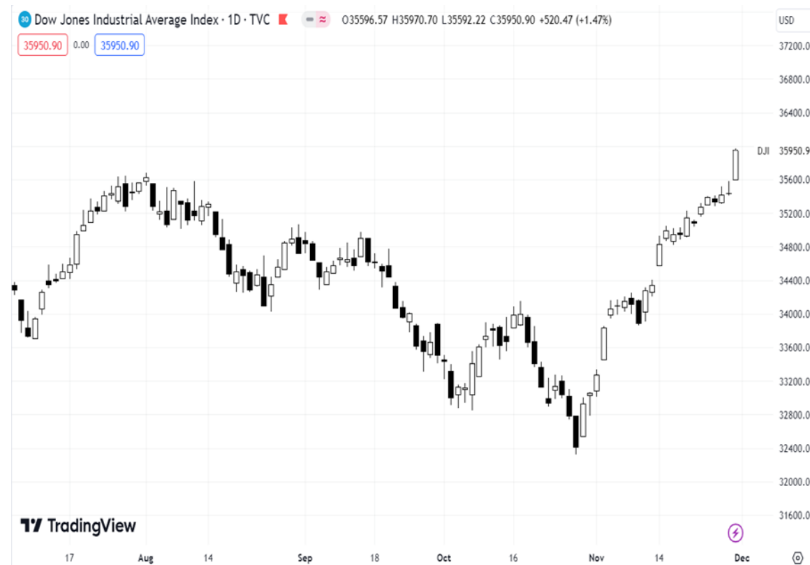
Diễn biến chỉ số Dow Jones.