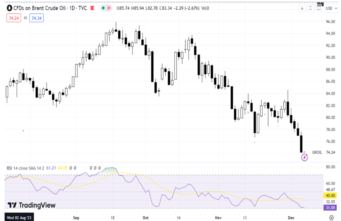
Diễn biến giá dầu Brent.