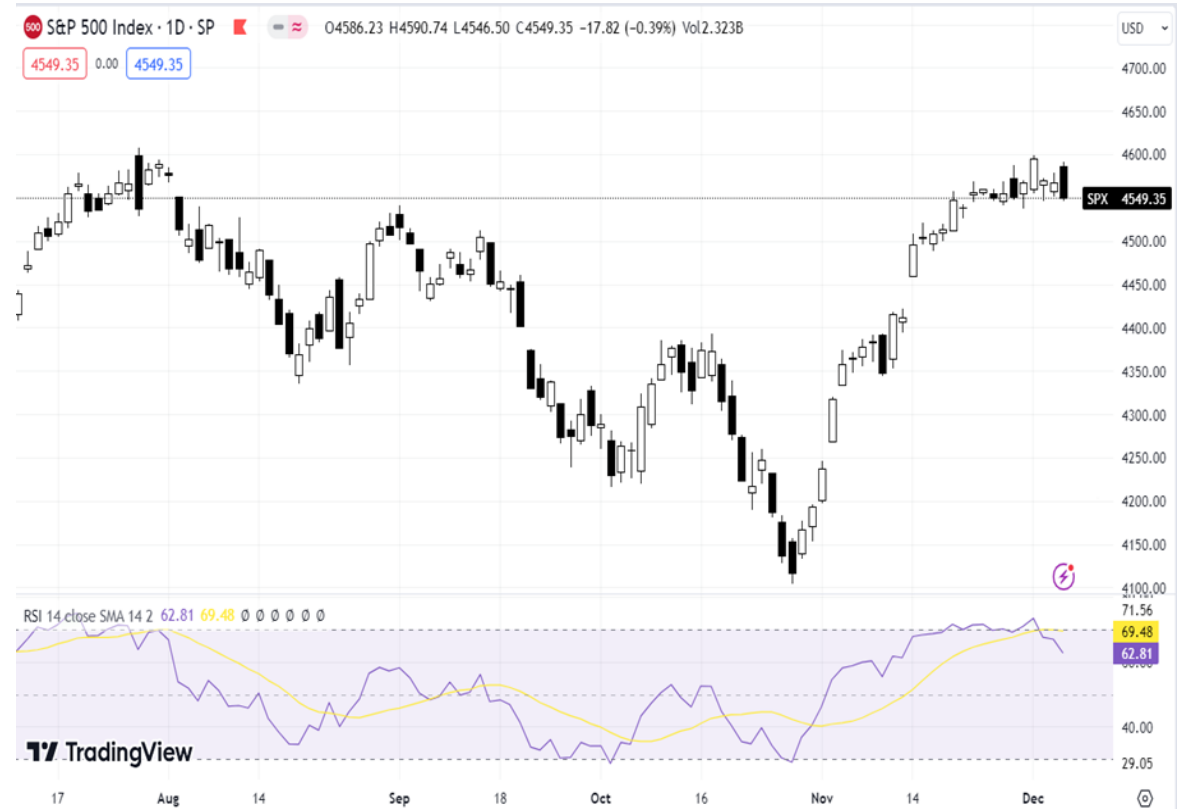
Diễn biến chỉ số S&P 500.