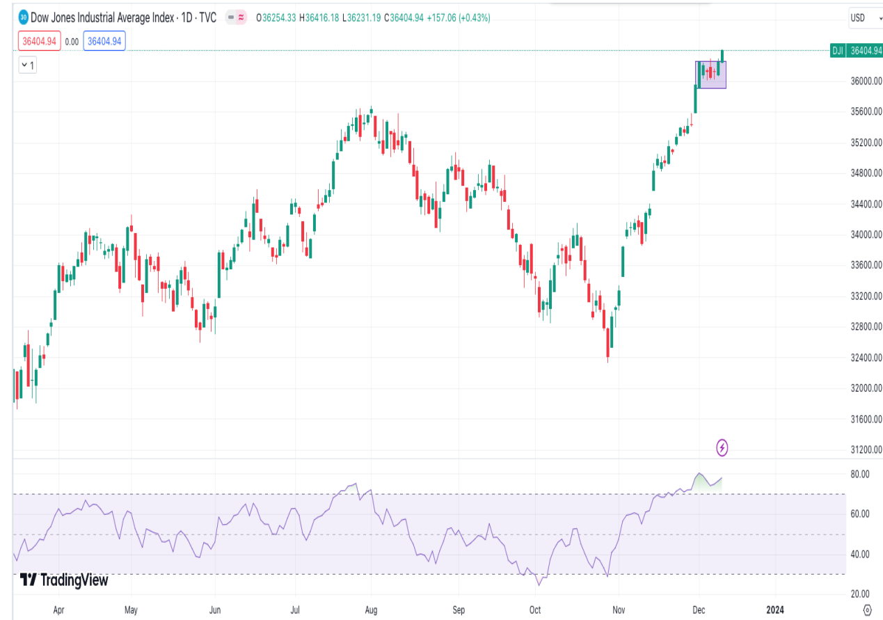
Diễn biến chỉ số Dow Jones.