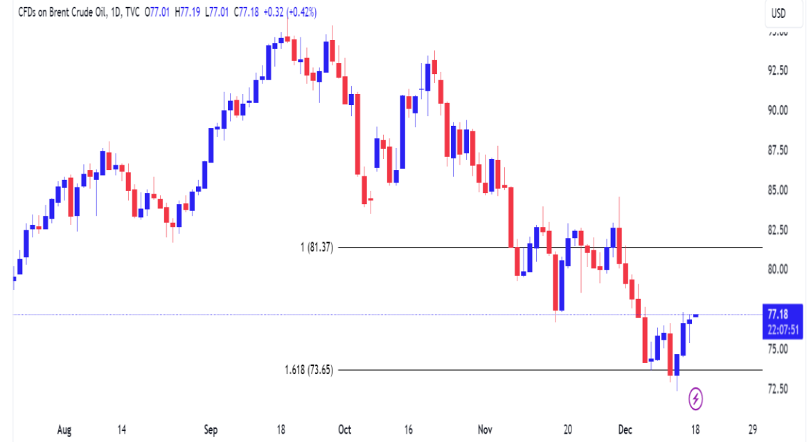
Diễn biến giá dầu Brent.