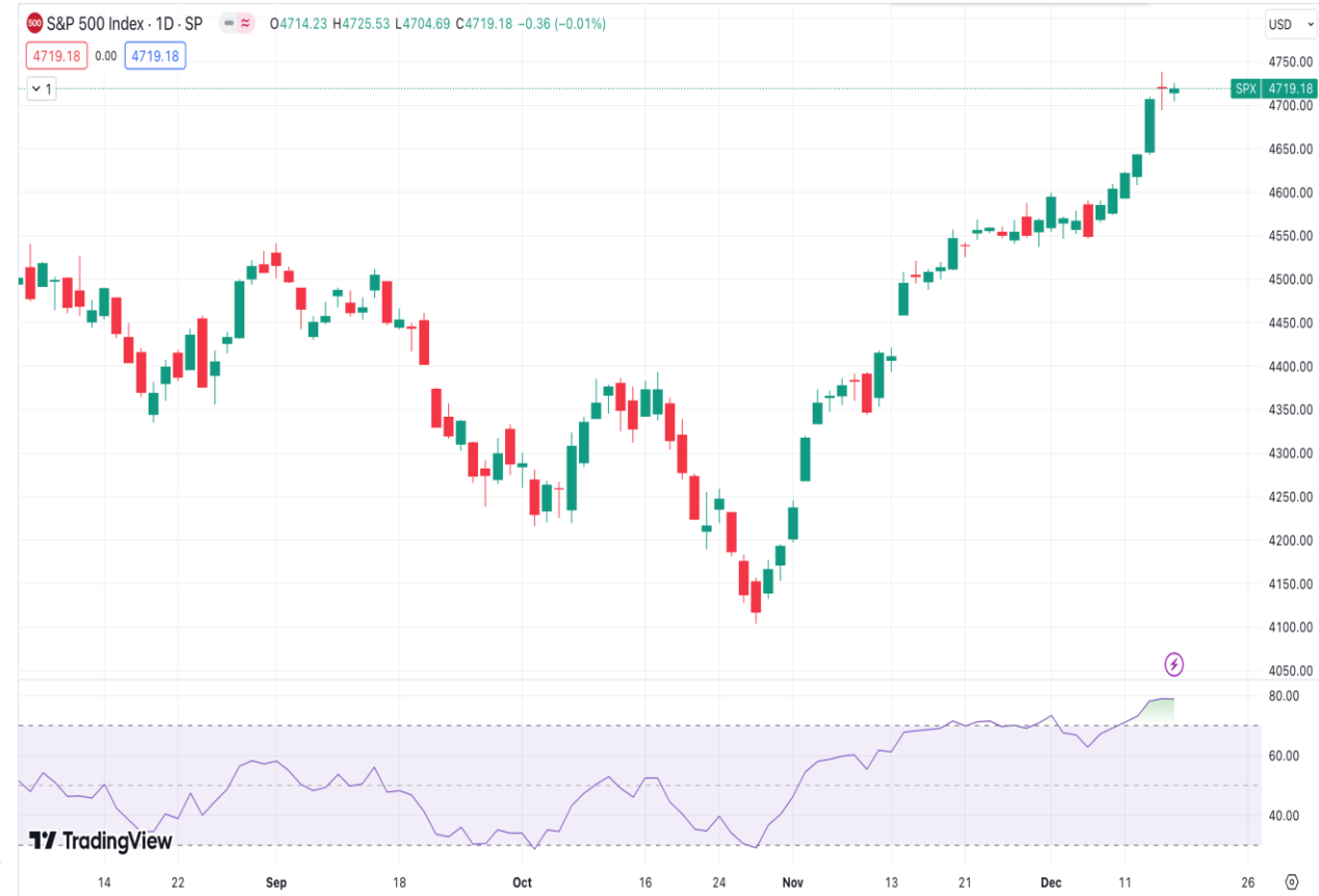
Diễn biến chỉ số S&P 500.