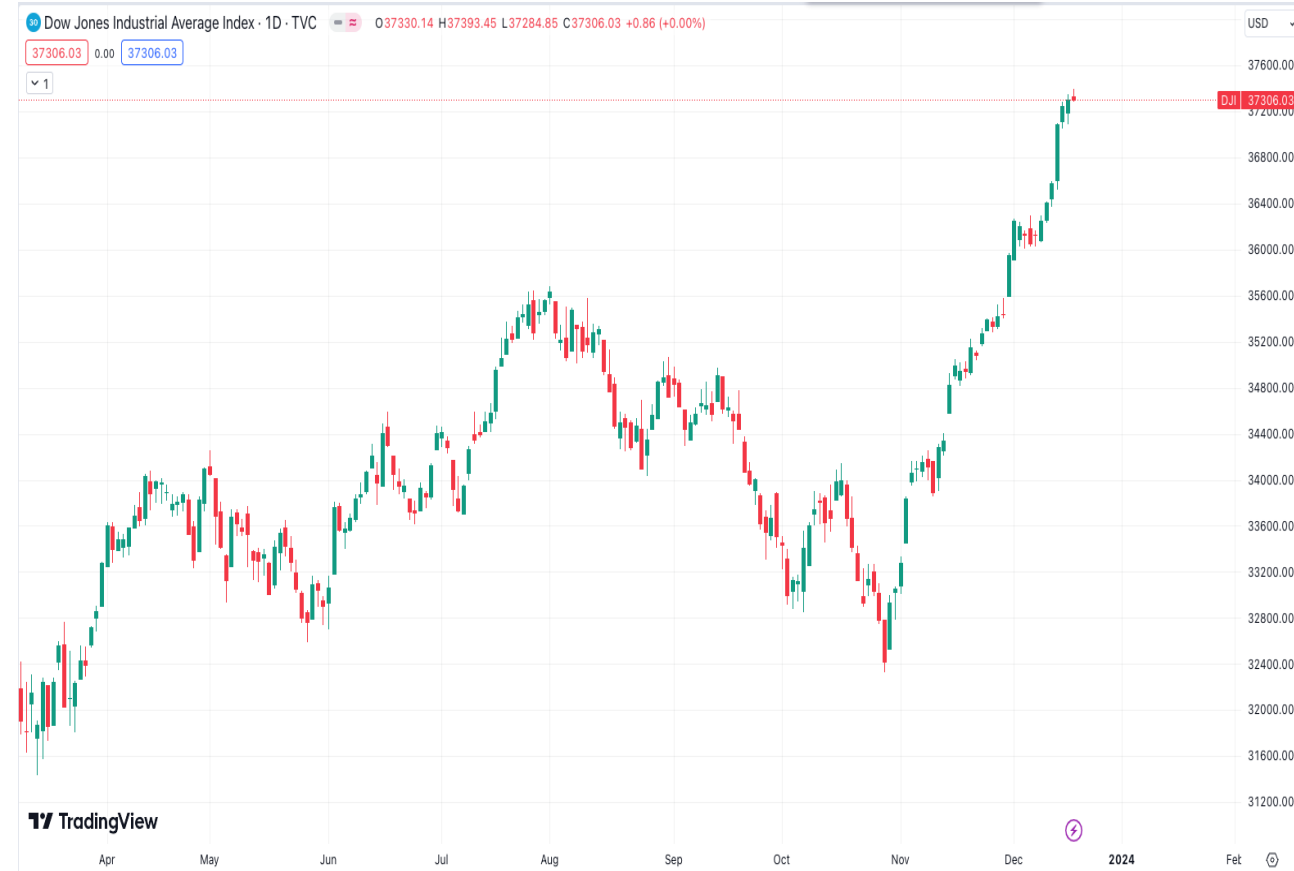
Diễn biến chỉ số Dow Jones . Nguồn: Tradingview