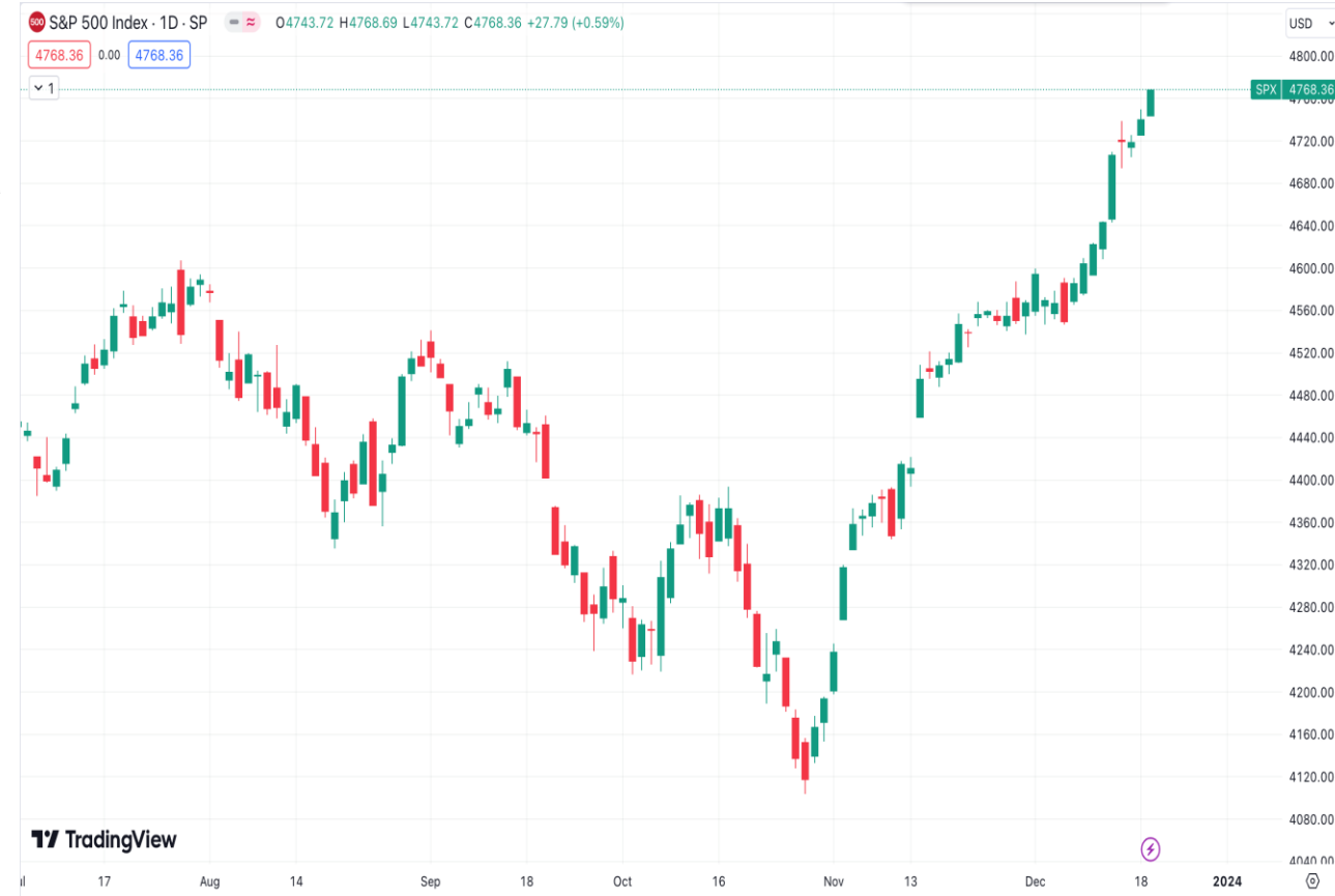
Diễn biến chỉ số S&P 500.