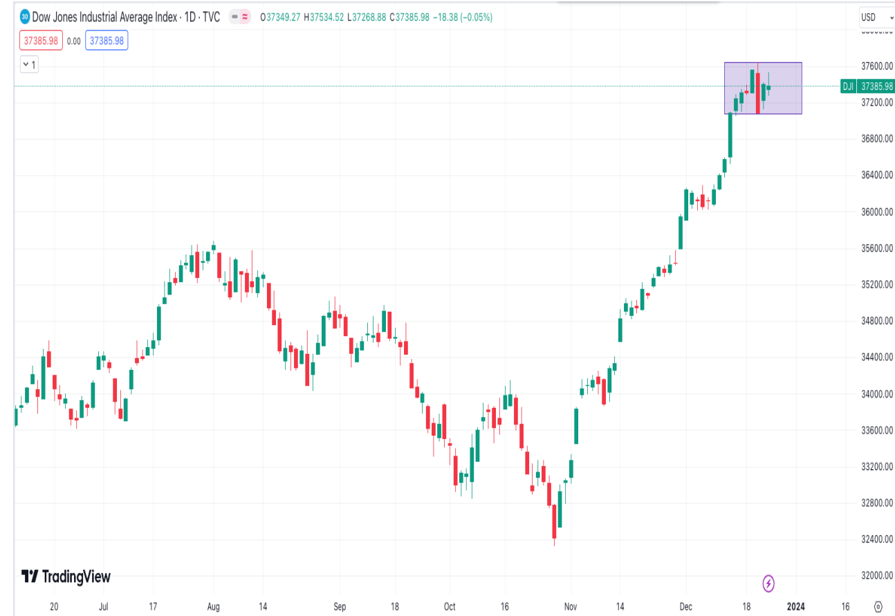
Diễn biến chỉ số Dow Jones.