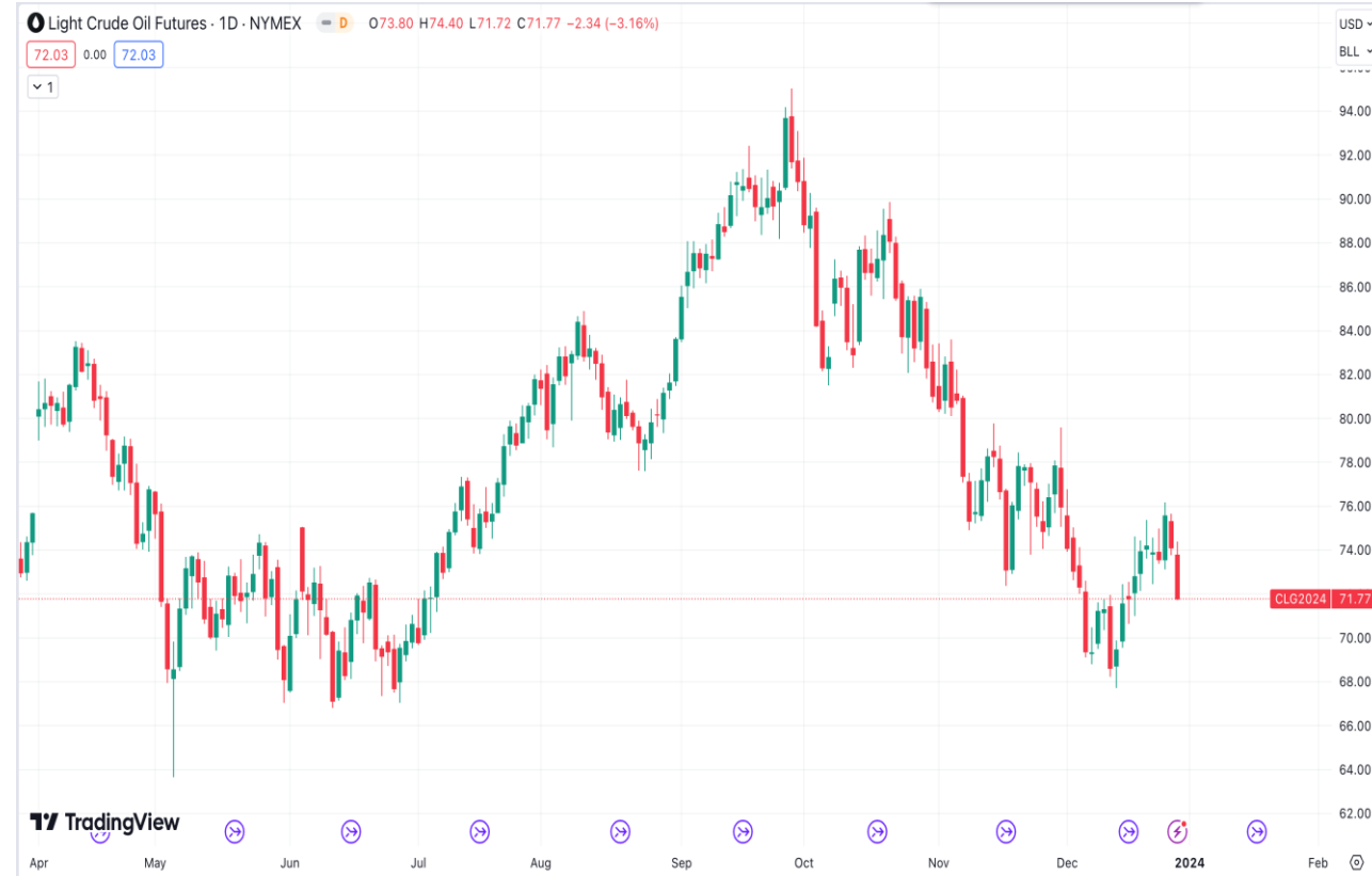
Diễn biến giá dầu thô WTI.