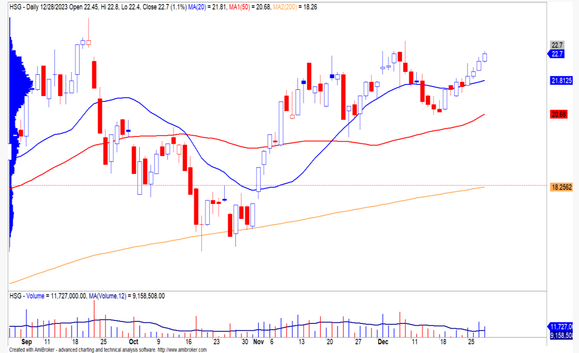
Diễn biến giá cổ phiếu HSG.