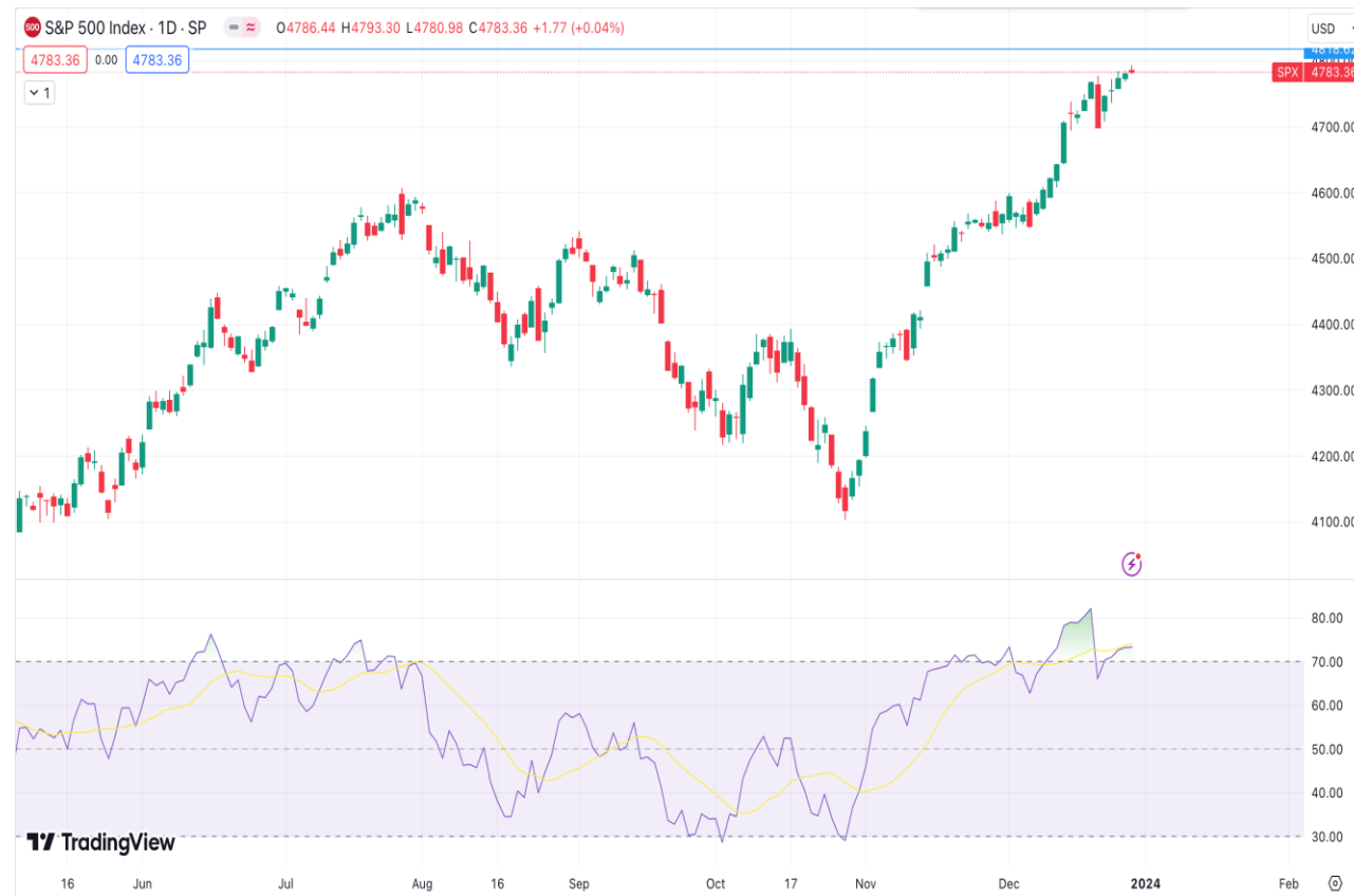
Diễn biến chỉ số S&P 500 .