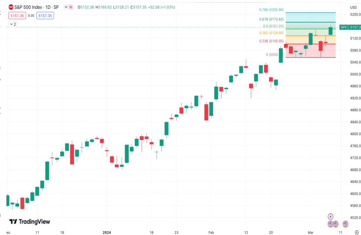
Diễn biến chỉ số S&P 500