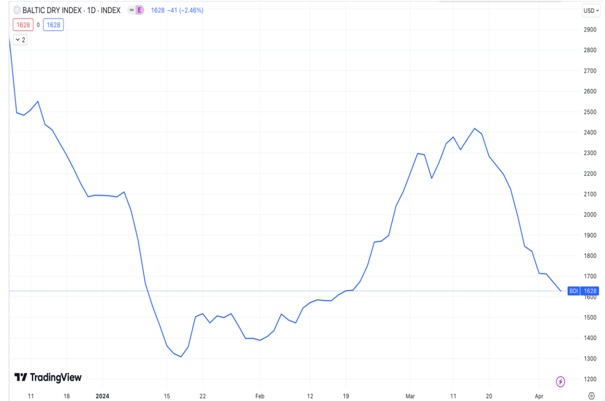
Diễn biến chỉ số BDI