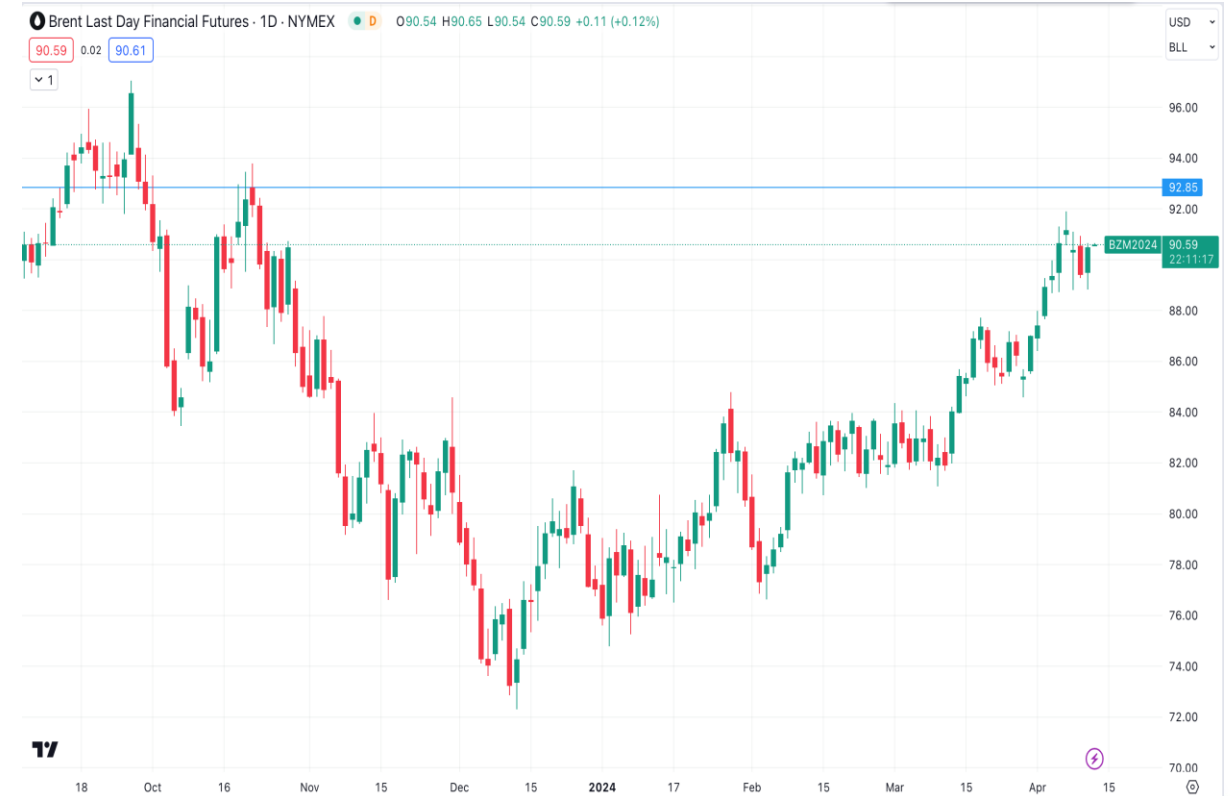
Diễn biến giá dầu Brent