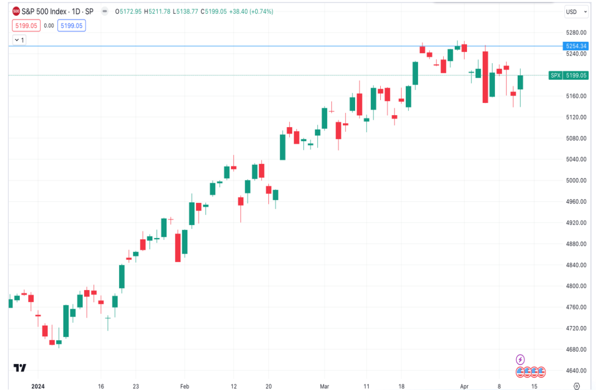
Diễn biến chỉ số S&P 500