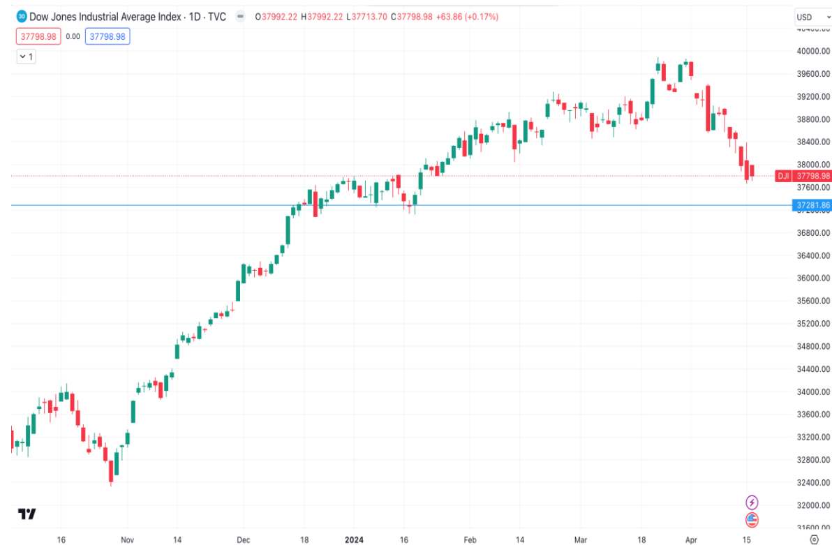
Diễn biến chỉ số Dow Jones