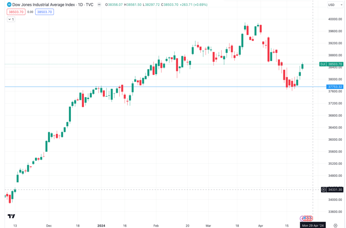
Diễn biến chỉ số Dow Jones