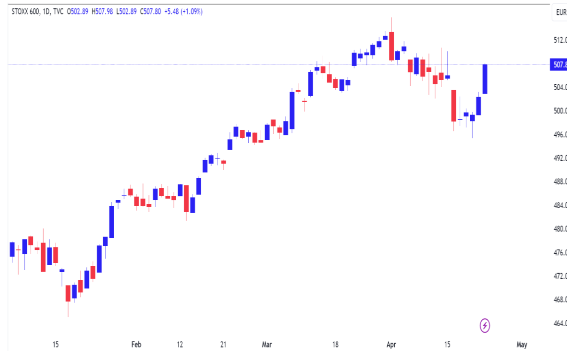
Diễn biến chỉ số STOXX 600