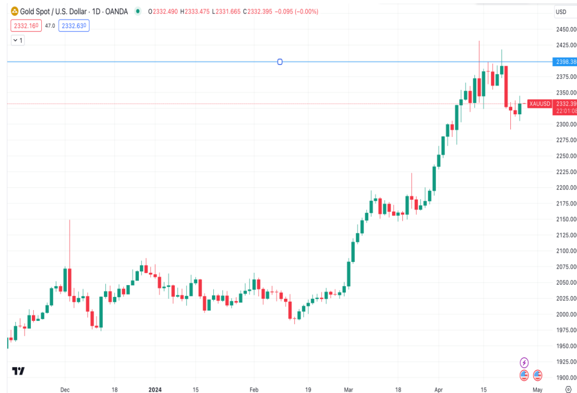
Diễn biến giá vàng