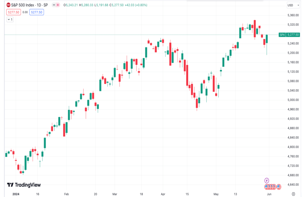
Diễn biến chỉ số S&P 500