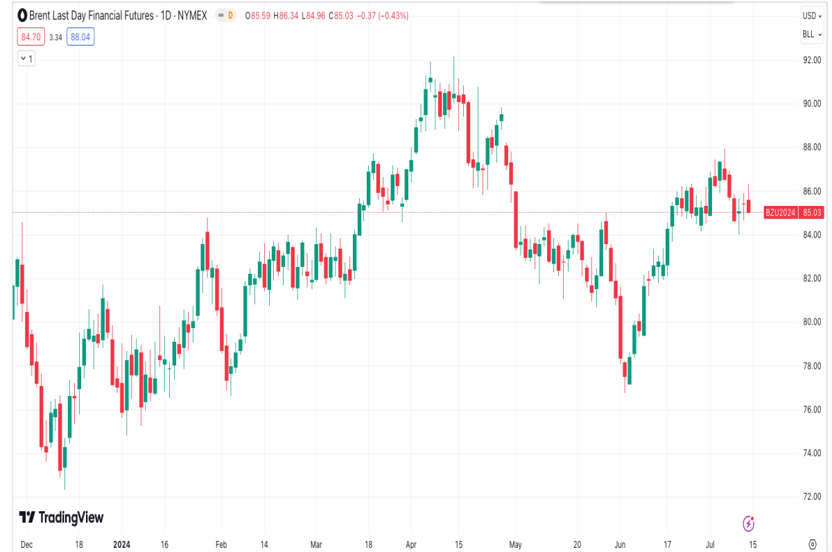
Diễn biến giá dầu Brent