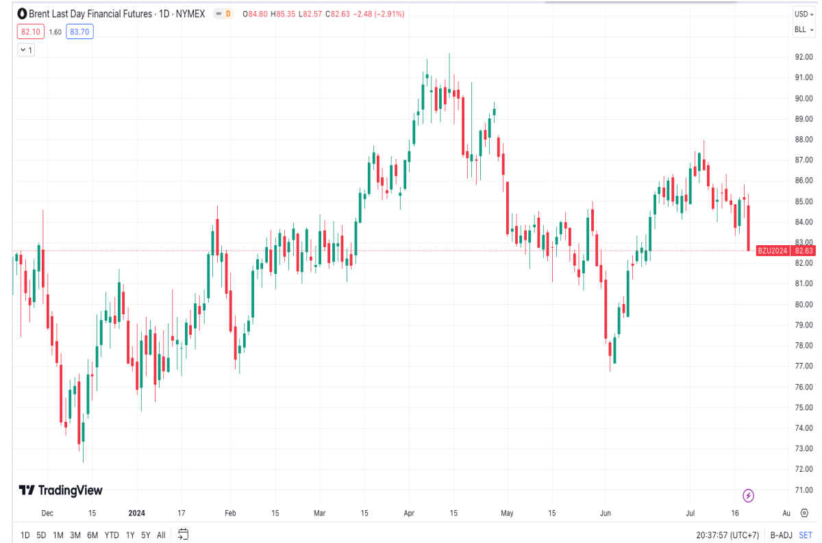
Diễn biến giá Brent