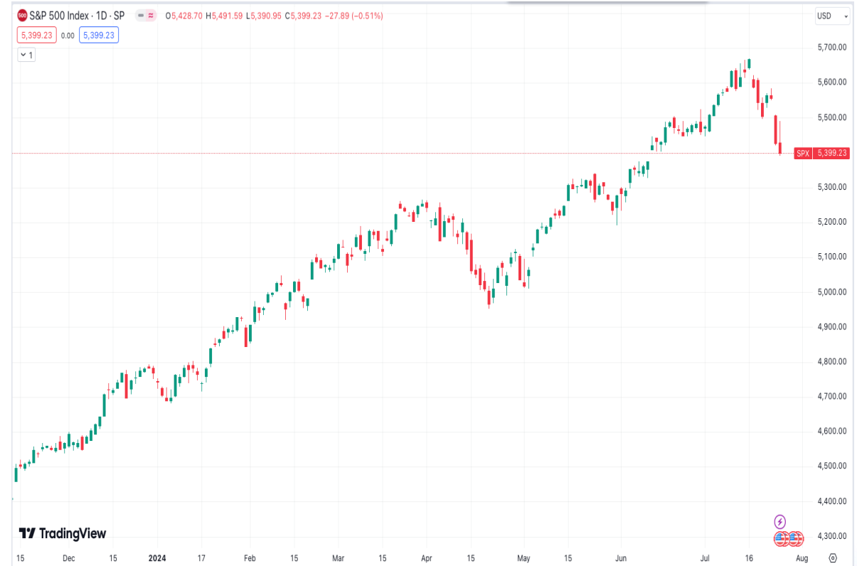
Diễn biến chỉ số S&P 500