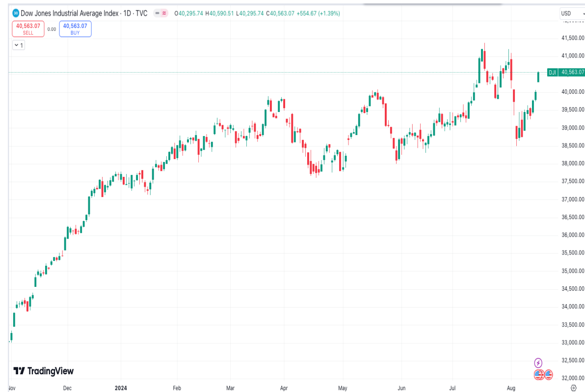
Diễn biến chỉ số Dow Jones