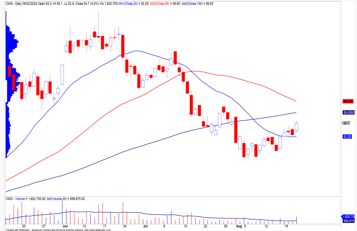
Diễn biến giá cổ phiếu CMG.