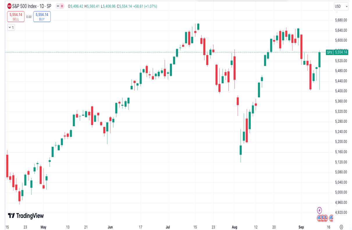
Diễn biến chỉ số S&P 500