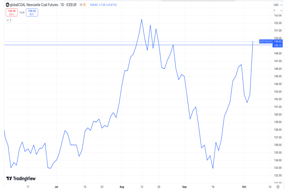
Diễn biến giá than