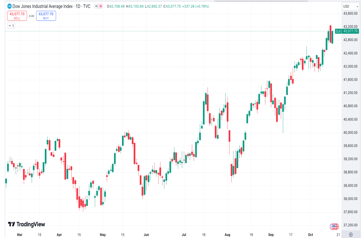
Diễn biến chỉ số Dow Jones