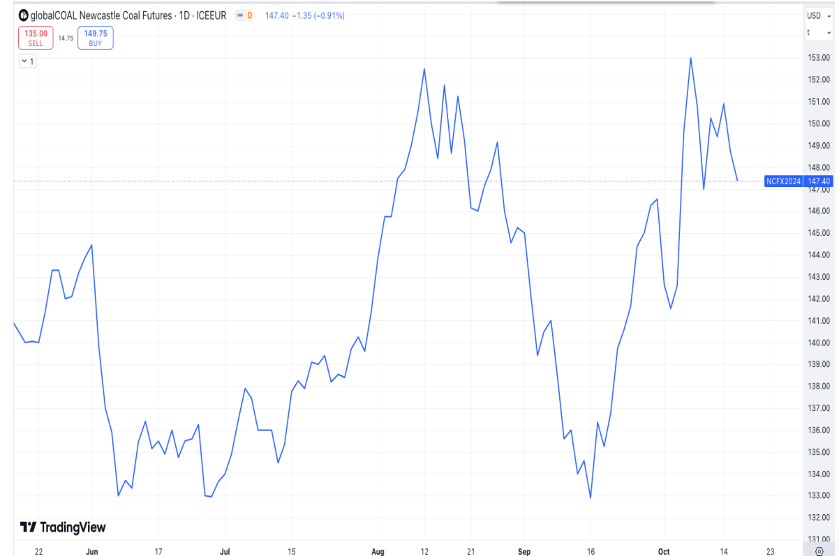
Diễn biến giá than