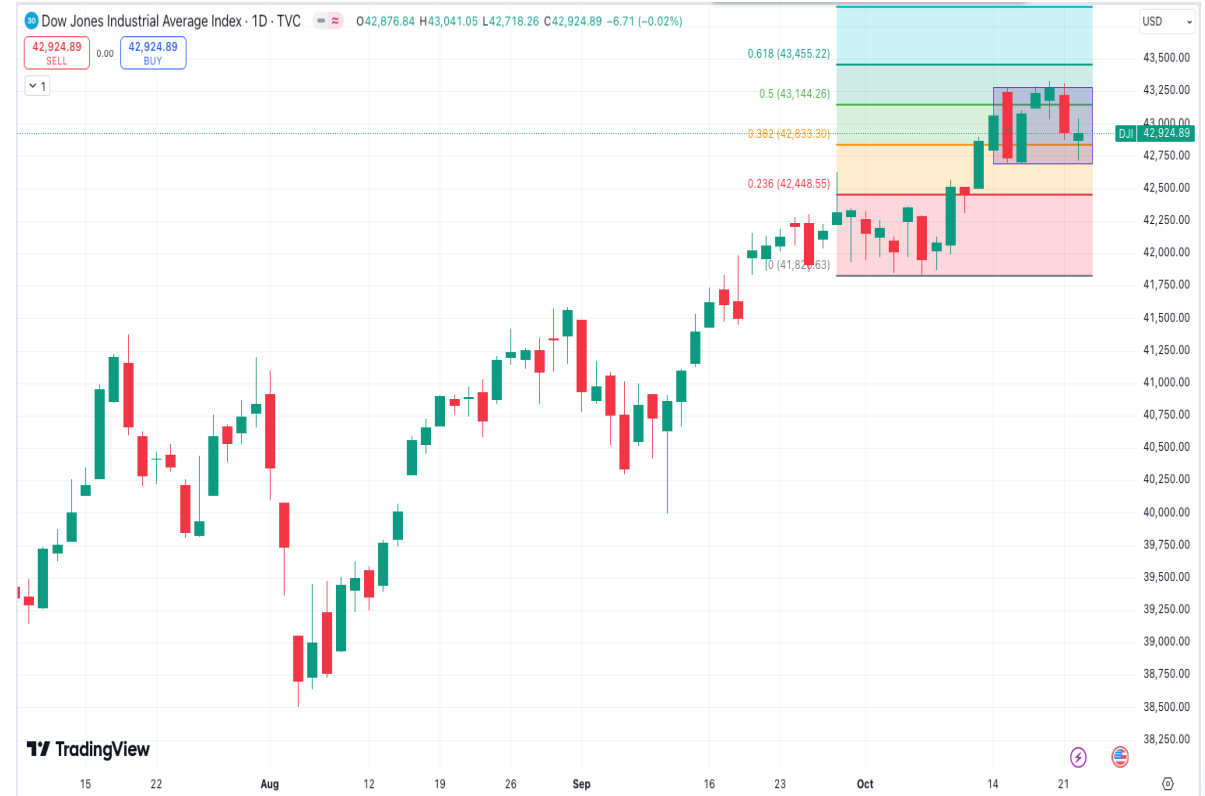
Diễn biến chỉ số Dow Jones