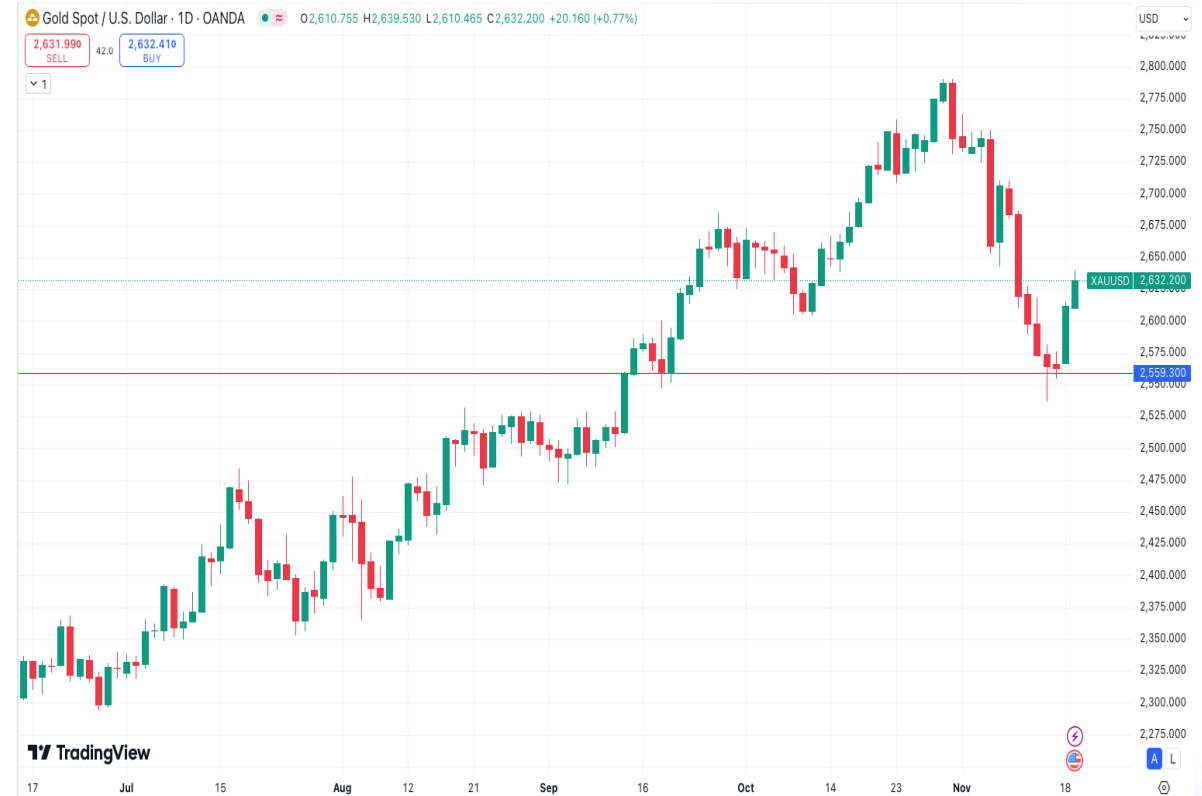
Diễn biến giá vàng