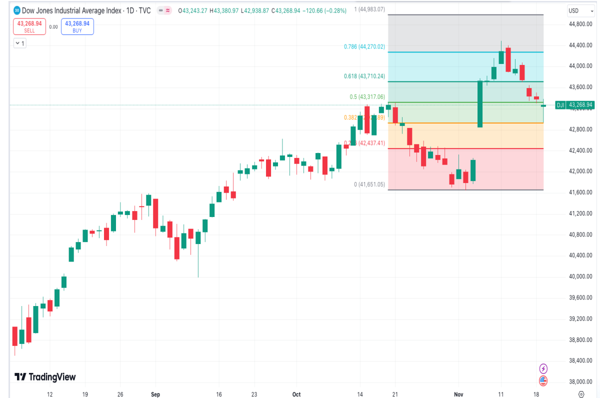
Diễn biến chỉ số Dow Jones