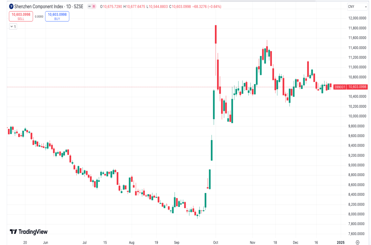
Diễn biến chỉ số Shenzhen Component