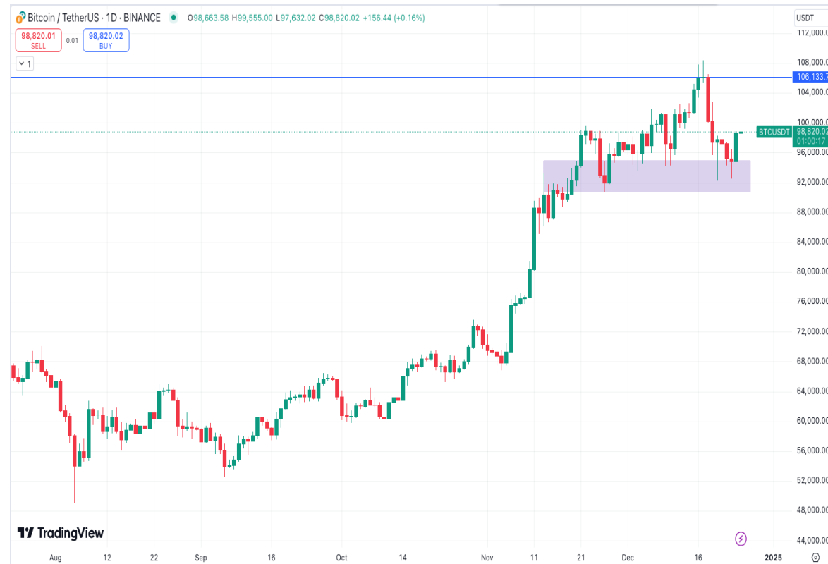
Diễn biến giá bitcoin